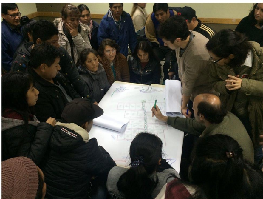
Figura 6. Talleres por manzana