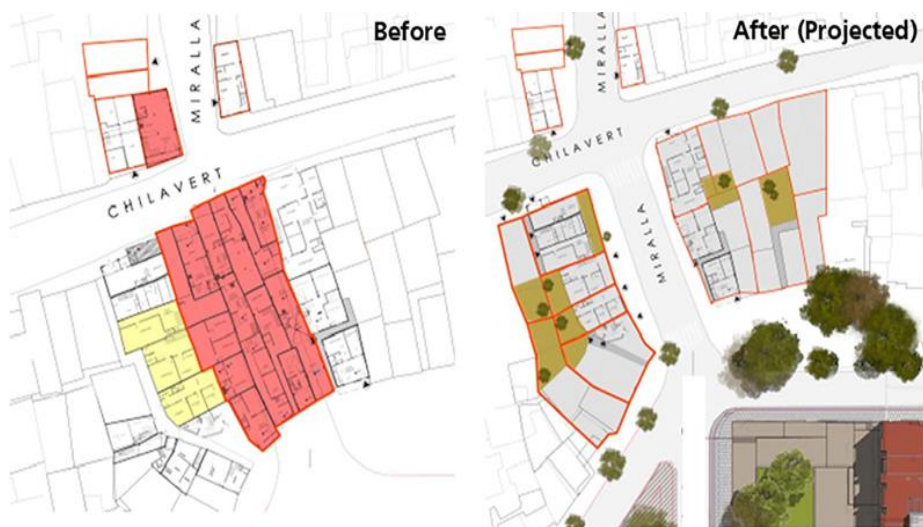
Figura 7. Proyecto de transformación de una manzana (afectación parcial en Amarillo, afectación total en rojo)