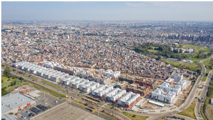
Figura 11. Nuevas viviendas Papa Francisco