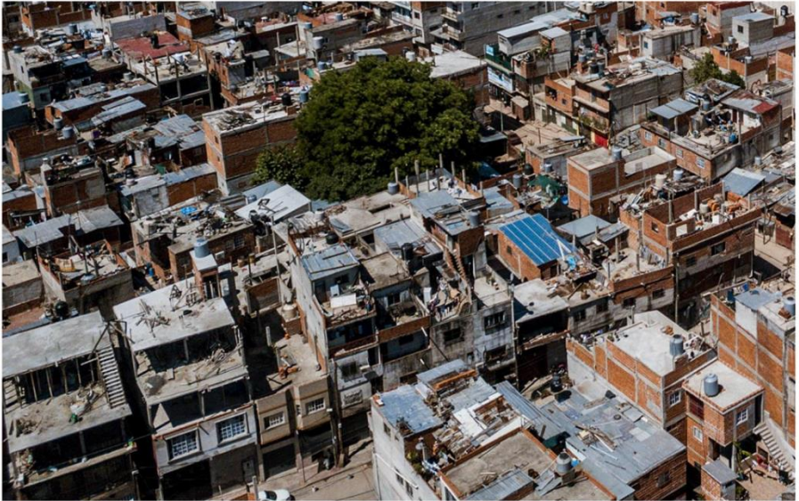
Figura 2-3. Vistas de Villa 20