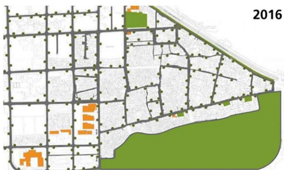
Figura 10. Evolución del PIRU 2016-2019