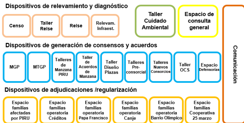
Figura 5. Dispositivos de soporte del proceso participativo Villa 20