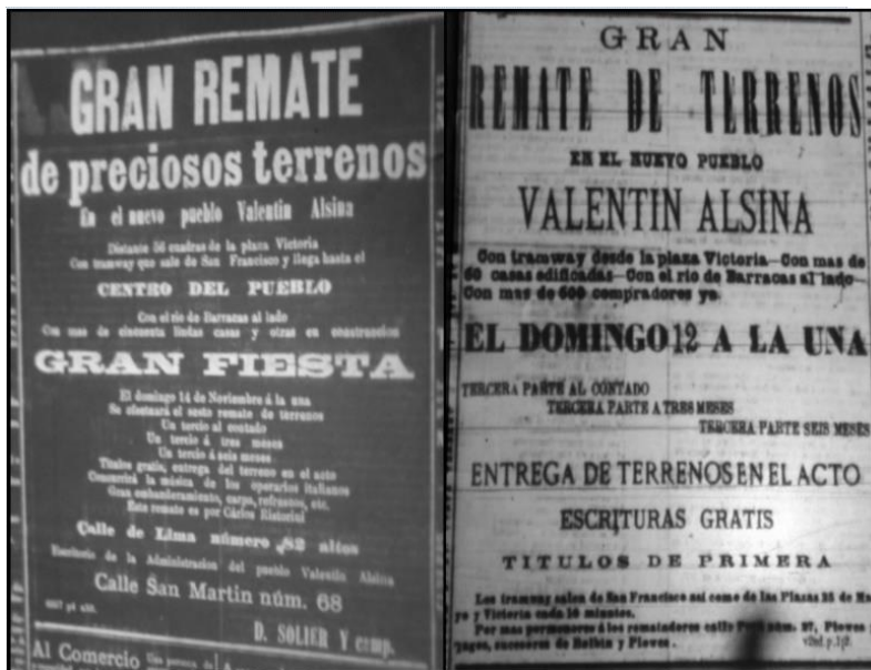
Figura 2. Avisos de los remates de terrenos en Valentín Alsina (1875)