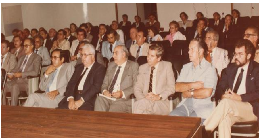
Imagen 12: Asamblea de representantes de centros de Venezuela con dirigentes del IEE (1984).