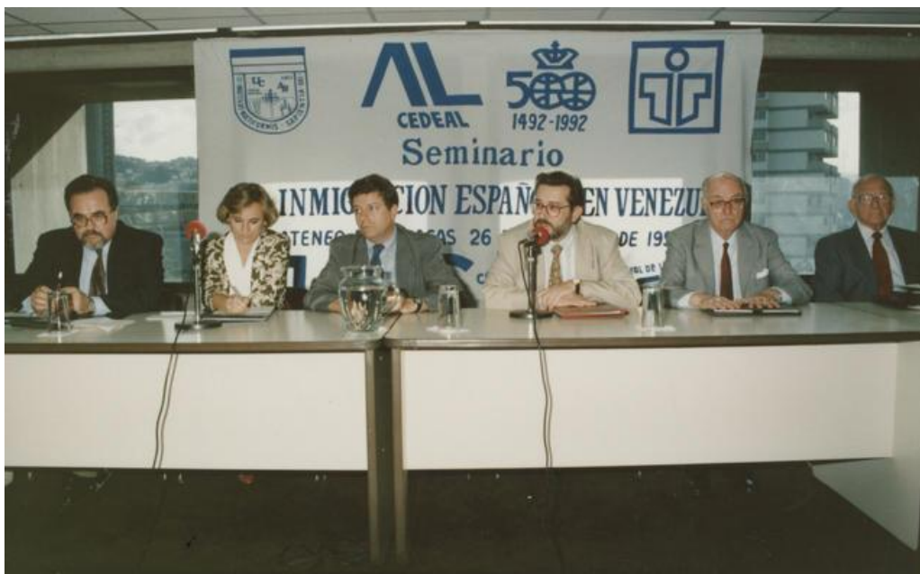
Imagen 14: Congreso sobre inmigración española en Venezuela (1992).

Distintas son las imágenes 15 y 16 donde se puede ver ya con nombre, apellido y cargo político a la Subdirectora de la Subdirección General de Ordenación de las Migraciones, Ángeles Muñoz Uriol, primera personera del gobierno del popular José María Aznar, en hacer una visita oficial a Caracas y reunirse con la emigración española. La revista Carta de España consigna un amplio reportaje fotográfico a esa visita y se puede ver a la Subdirectora Muñoz en distintas escenas y encuentros con las asociaciones y la comunidad de emigrantes. En un primer plano, la imagen 15 enseña un encuentro con la Hermandad Gallega de Valencia, cuyo director le otorga una distinción a la personera de gobierno. Interesante también en este seguimiento es la imagen 16 donde por primera vez en el apartado de archivo fotográfico seleccionado por la publicación en este destino, pueden verse fotos oficiales de representantes mujeres de las asociaciones de la emigración española en Caracas, en mayoría respecto de sus representantes varones y no en un plano secundario.