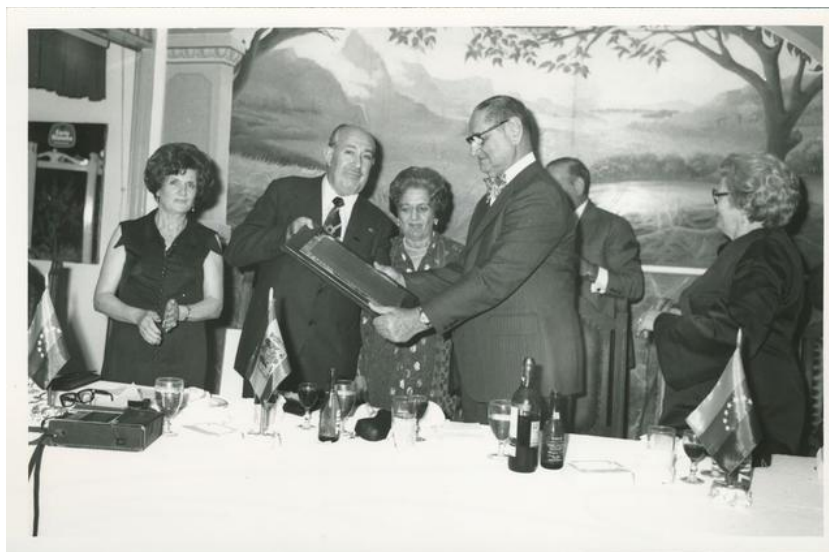
Imagen 3: Fotografía de la Federación de Centros Españoles de Venezuela (FECEVE) (1969). Fuente: Archivo fotográfico revista Carta de España.