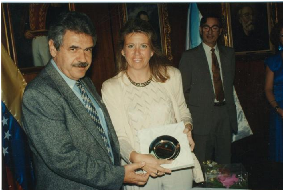
Imagen 15: Visita de la Subdirectora de la Subdirección General de Ordenación de las Migraciones. Ángeles Muñoz Uriol en la Hermandad Gallega de Valencia (1997).