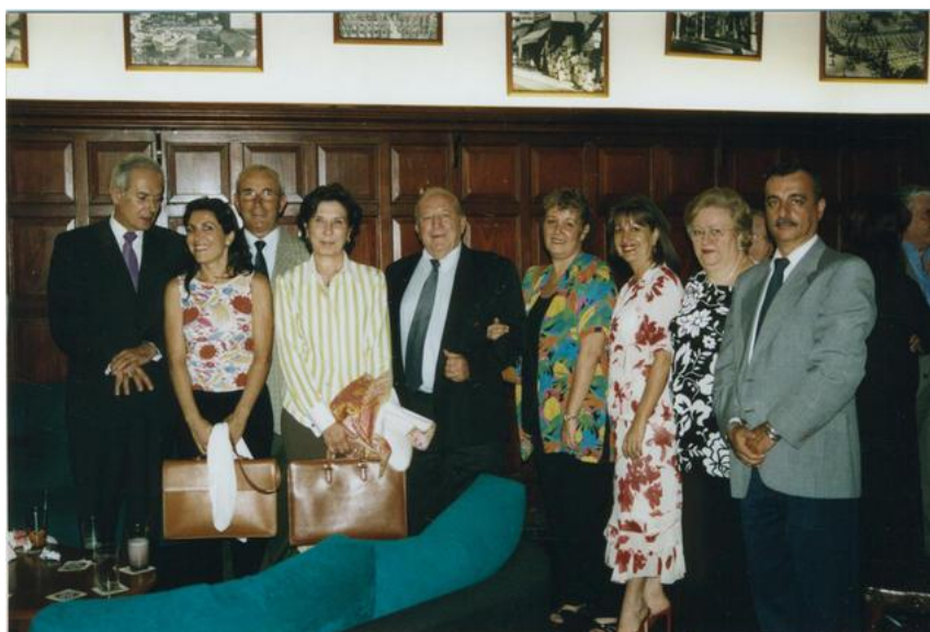
Imagen 16: Visita de la Subdirectora de la Subdirección General de Ordenación de las Migraciones (1997).