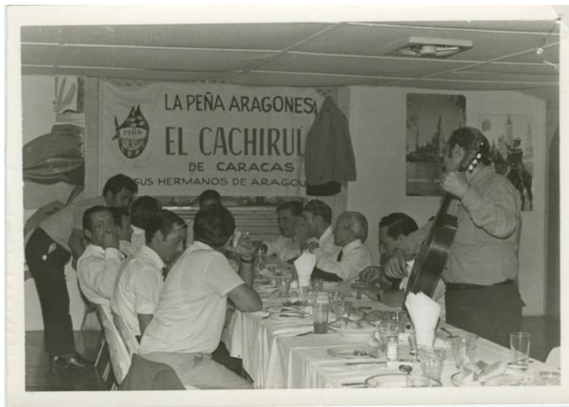
Imagen 1: Un momento de la peña aragonesa “El cachirulo” en Caracas (1964).