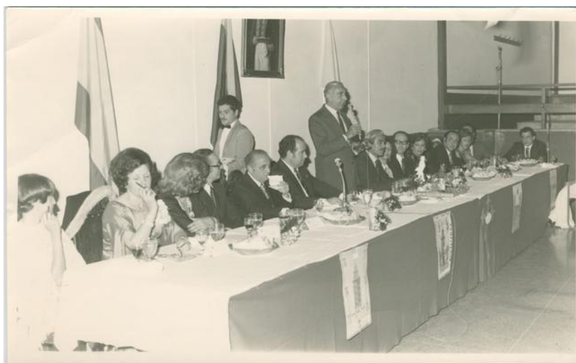
Imagen 4: Discurso del Embajador de España en la toma de posesión de la Junta Directiva de la Hermandad Gallega (1969).