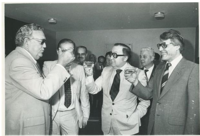
Imagen 6: Firma del contrato para la construcción del Centro Español Iberoamericano de Caracas (1976).