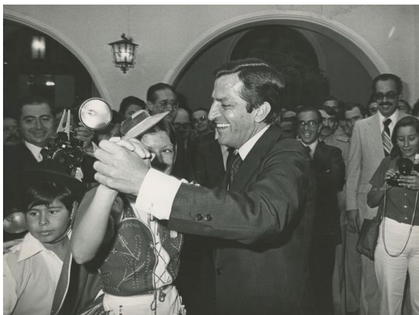
Imagen 8: Suárez en Caracas. Un momento de la visita oficial que el Presidente del Gobierno don Adolfo Suárez ha realizado al Hogar Canario (1978).