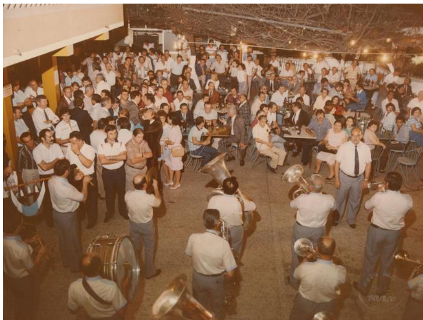
Imagen 9: Asociación "Amigos de Santiago" (1982).