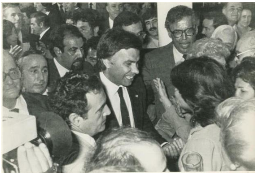
Imagen 11: El Presidente del Gobierno Español, Felipe González fue calurosamente recibido por españoles residentes en Venezuela durante su visita a la Embajada de España en Venezuela (1983).