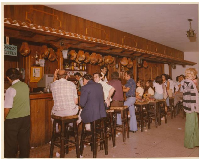
Imagen 10: Bar del Centro Asturiano de Caracas (1983).