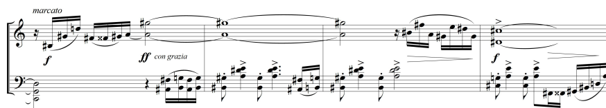
Ilustración 3. Preludio (Piazzolla), compases 18 a 21.

De Piazzolla en su producción académica hay muchos ejemplos (y no me refiero a los de su última etapa donde explícitamente llevó su Nuevo Tango al campo académico (como por ejemplo con su Concierto para Bandoneón ) sino a obras tempranas. Por ejemplo, en su Preludio para piano de 1953 19 , se desenvuelve en un estilo rapsódico, con una conducción melódica y armónica basada en un insistente cromatismo. Es una construcción formal más bien caprichosa que discurre con gran ambigüedad tonal, recurriendo a armonías que avanzan mucho en la escala de armónicos. En la segunda parte de la pieza (que es bipartita) dos elementos de fuerte carácter se juxtaponen. En el registro agudo, séptimas mayores sostenidas a lo largo de tres compases, separadas por una melodía quebrada y cromática. El otro elemento aparece como contraparte en la mano izquierda: un gesto compuesto por un bajo en corchea y un acorde en negra, y luego en negra con puntillo (ver Ilustración 3).