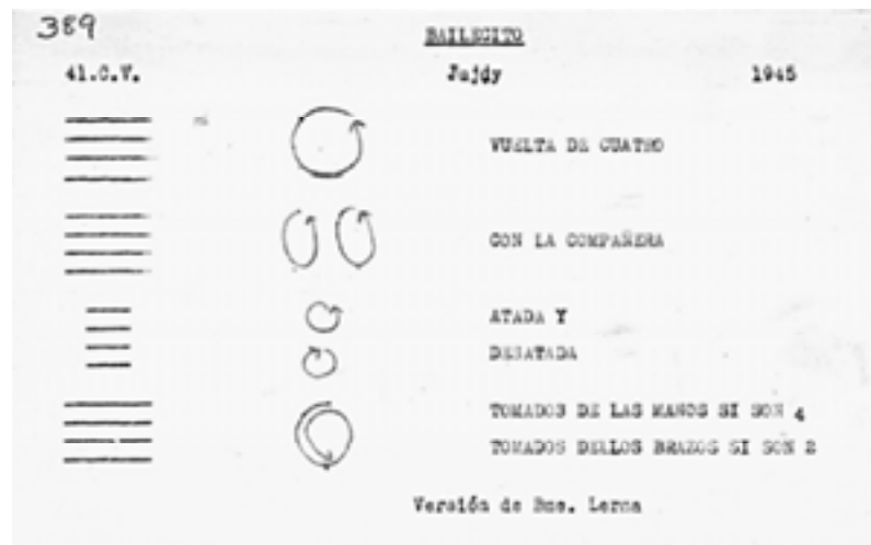
Fig. 2. Ficha 389, Bailecito. FDCV IIM. Esquema de la danza y estructura de los versos y las coplas.

Algunas fichas fueron escritas por Vega y otras por sus colaboradoras y discípulas; por esa razón se distinguen distintas caligrafías y se infiere que algunas fueron confeccionadas en el contexto del trabajo de campo y otras en gabinete 6 .