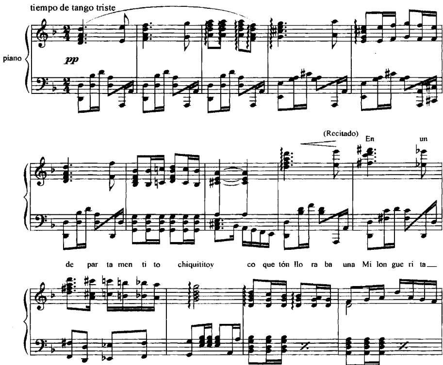
Ejemplo Musical Nº 2 - Almanaque de los sueños Nº 5: Una milonguera