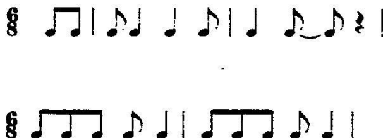
Imagen 4. Modelos rítmicos de danzas argentinas

Hemiolas tanto verticales como horizontales saturan la música argentina, sirviendo frecuentemente para subrayar e intensificar cambios armónicos. En la hemiola vertical, la melodía alterna entre los compases de 6/8 y 3/4, yuxtapuesta a un acompañamiento en 3/4, típica fórmula de gato y chacarera (Imagen 5).