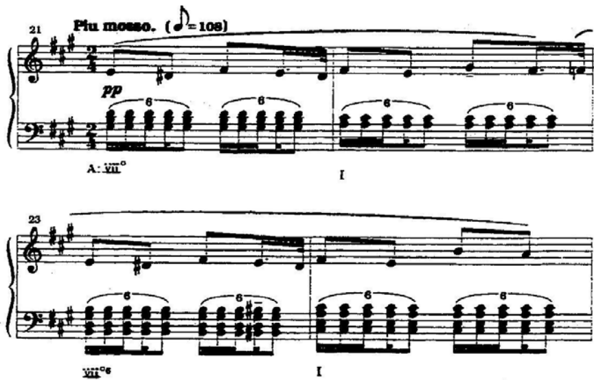
Imagen 2. El rancho abandonado , cc. 21 – 24.

elementos de la música criolla en El rancho abandonado coincidía decidida e indudablemente con el ideal de país promovido por la elite política e intelectual porteña de la Argentina del Centenario. 58