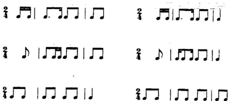
Ejemplo 6. Modelos Rítmicos de la Milonga