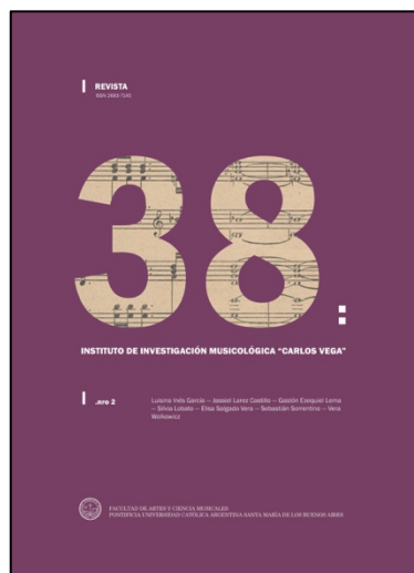
Revista del Instituto de Investigación Musicológica Carlos Vega , Año XXXVIII, Vol. 38, N° 2