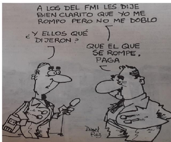
Imagen 3: Alfonsín en el marco de las negociaciones de la deuda externa (por Daniel Paz)