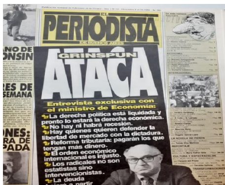
Imagen 1: Tapa de El Periodista de Buenos con el ministro Bernardo Grinspun y sus principales declaraciones hacia el final de su mandato.